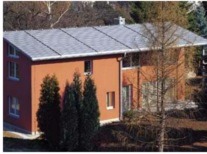
Das weltweit erste vollständig mit QUICK STEP®-SolarThermie beheizte Wohnhaus