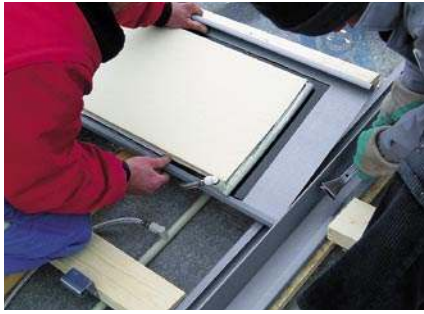
Montage der steckfertig verrohrten QUICK STEP®-Solar-Paneele