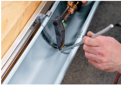
Dauerhafte metallische Verbindung durch optimale Werkstoffkombination